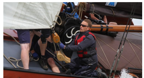
SKS-wedstrijd op Stavoren is winst- en verliesrekening