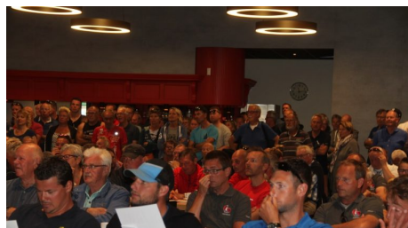
SKS-zeilwedstrijd Woudsend: na afhandelen protesten